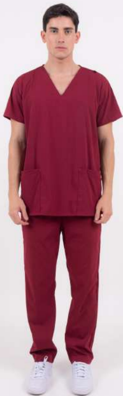
AMBO LISO Full Bordó CORE SPANDEX

MCLI382EXT (MAS) CH LISA Bordó CORE SPANDEX UPBD382EXT (UNI) PANT BRAND Bordó CORE SPANDEX