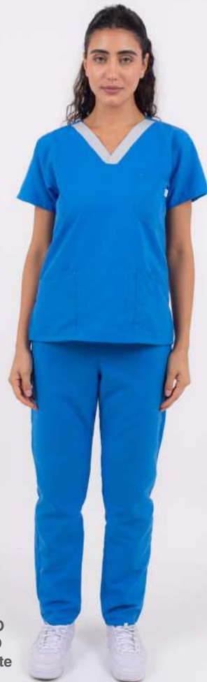
AMBO ECCO Celeste

FCEE716DOT (FEM) CH ECCO Gris DOTEX cuello Celeste UPEE716DOT (UNI) PANT ECCO Gris DOTEX