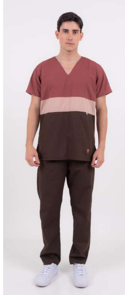
Ambo TRICOLOR Terra MCTR268ART (MAS) CH TRICOLOR Terra ARCIEL UPBD680ART (UNI) PANT BRAND Chocolate ARCIEL