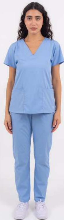
AMBO LISO Full Celeste CORE SPANDEX

FCL1490EXT (FEM) CH LISA Azul Marino CORE SPANDEX UPBD490EXT (UNI) PANT BRAND Azul Marino CORE SPANDEX