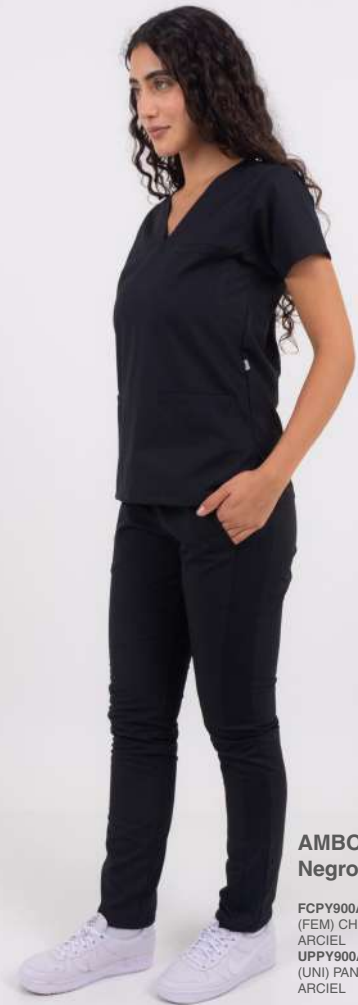
AMBO SHAPY Negro

FCPY900ART (FEM) CH SHAPY Negro ARCIEL UPPY900ART (UNI) PANT SHAPY Negro ARCIEL