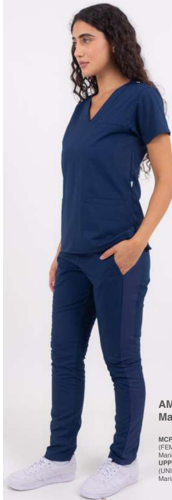
AMBO SHAPY Marino

FCPY708ART (FEM) CH SHAPY Gris Perla ARCIEL con LYCRA UPPY708ART (UNI) PANT SHAPY Gris Perla ARCIEL con LYCRA