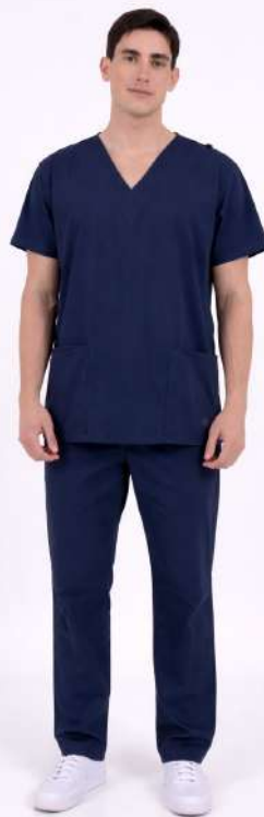
AMBO LISO Full Marino CORE SPANDEX

MCLI580EXT (MAS) CH LISA Verde Inglés CORE SPANDEX UPBD580EXT (UNI) PANT BRAND Verde Inglés CORE SPANDEX