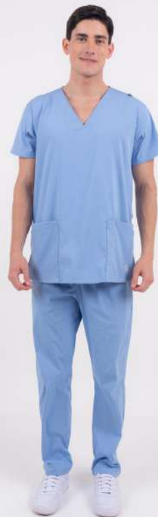
AMBO LISO Full Celeste CORE SPANDEX

MCLI490EXT (MAS) CH LISA Azul Marino CORE SPANDEX UPBD490EXT (UNI) PANT BRAND Azul Marino CORE SPANDEX