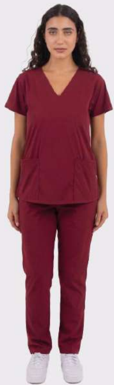
AMBO LISO Full Bordó CORE SPANDEX

FCL1382EXT (FEM) CH LISA Bordó CORE SPANDEX UPBD382EXT (UNI) PANT BRAND Bordó CORE SPANDEX