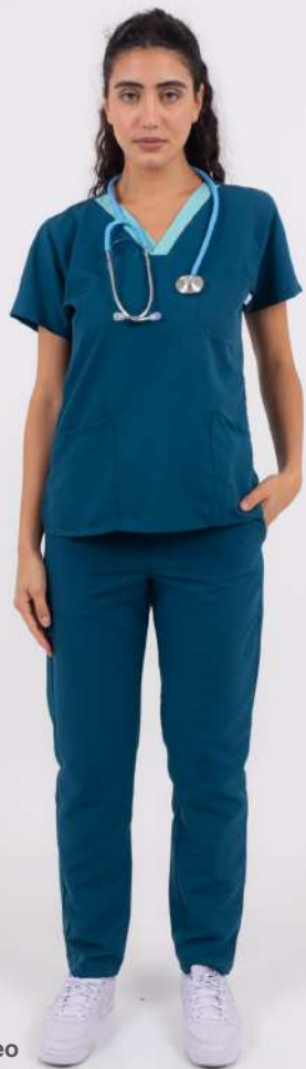
AMBO ECCO Petróleo

FCEE730DOT (FEM) CH ECCO Petróleo DOTEX cuello Verde Cirugia UPEE730DOT (UNI) PANT ECCO Petróleo DOTEX