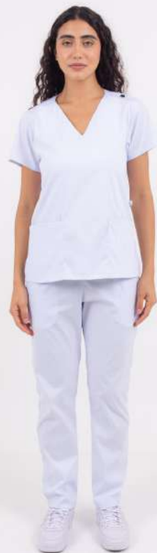
AMBO LISO Full Blanco CORE SPANDEX

FCL1410EXT (FEM) CH LISA Celeste CORE SPANDEX UPBD410EXT (UNI) PANT BRAND Celeste CORE SPANDEX