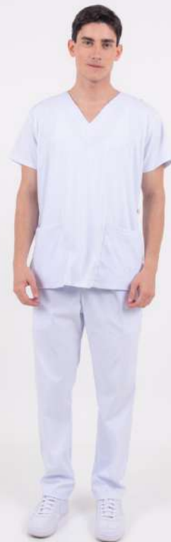
AMBO LISO Full Blanco CORE SPANDEX

MCLI410EXT (MAS) CH LISA Celeste CORE SPANDEX UPBD410EXT (UNI) PANT BRAND Celeste CORE SPANDEX