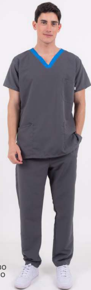
AMBO ECCO Gris

MCFY418DOT (MAS) CH ECCO Celeste Plus DOTEX Cuello Gris UPFY418DOT (UNI) PANT ECCO Celeste Plus DOTEX