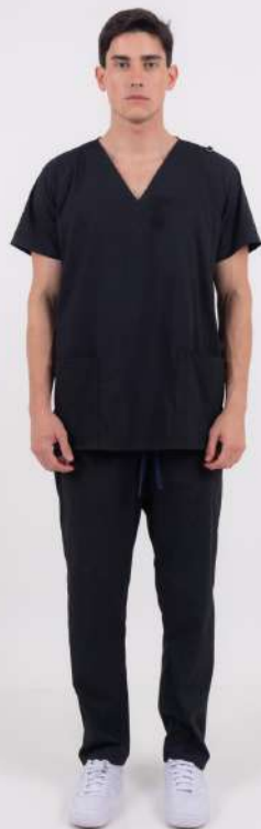
AMBO LISO Full Negro CORE SPANDEX

MCLI382EXT (MAS) CH LISA Bordó CORE SPANDEX UPBD382EXT (UNI) PANT BRAND Bordó CORE SPANDEX