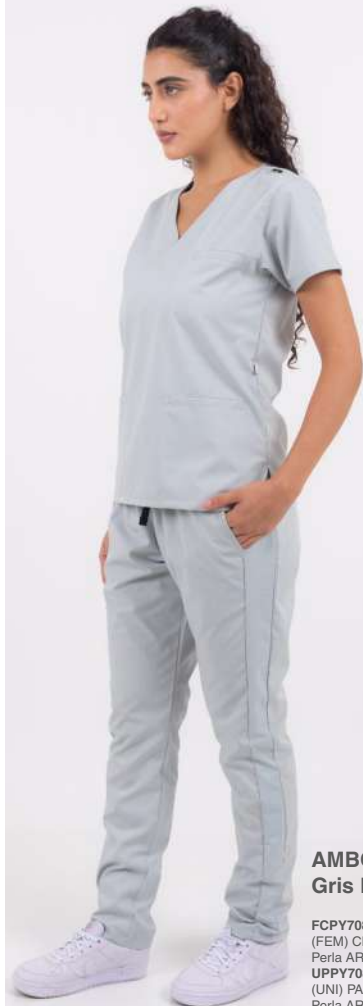
AMBO SHAPY Gris Perla

FCPY900ART (FEM) CH SHAPY Negro ARCIEL UPPY900ART (UNI) PANT SHAPY Negro ARCIEL