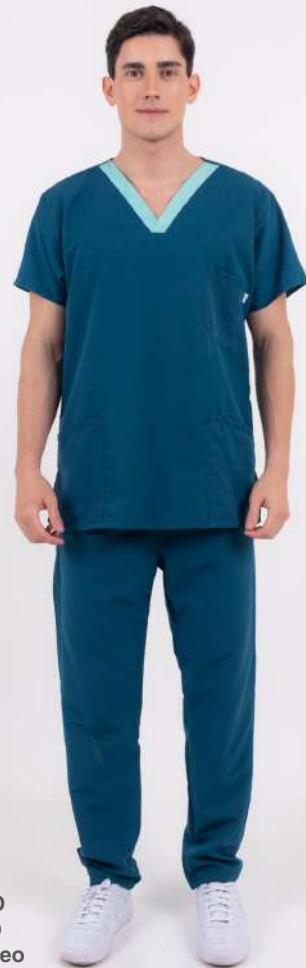
AMBO ECCO Petróleo

MCEE716DOT (MAS) CH ECCO Gris DOTEX cuello Celeste UPEE716DOT (UNI) PANT ECCO Gris DOTEX