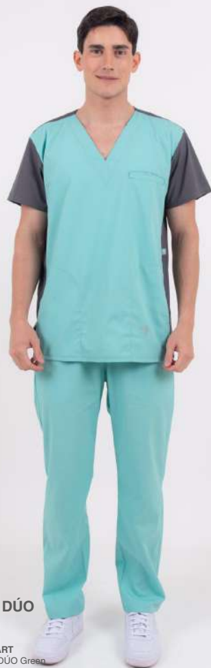
AMBO DÚO Green

FCFR549ART (FEM) CH DÚO Green UPBD549ART (UNI) PANT BRAND Verde Aqua ARCIEL