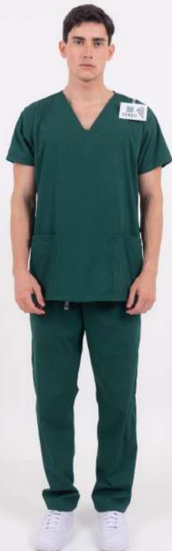
AMBO LISO Full Verde Inglés CORE SPANDEX

MCLI900EXT (MAS) CH LISA Negro CORE SPANDEX UPBD900EXT (UNI) PANT BRAND Negro CORE SPANDEX