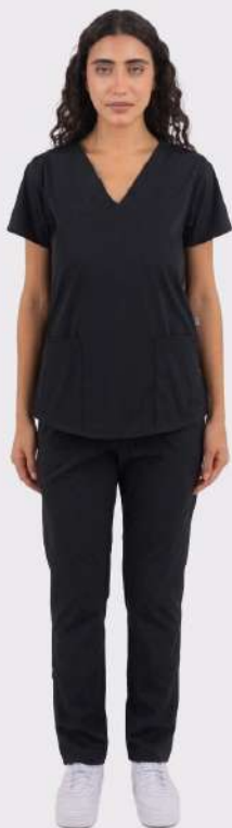
AMBO LISO Full Negro CORE SPANDEX

FCL1382EXT (FEM) CH LISA Bordó CORE SPANDEX UPBD382EXT (UNI) PANT BRAND Bordó CORE SPANDEX