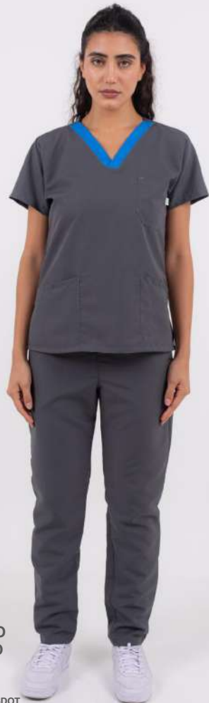
AMBO ECCO Gris

FCEE730DOT (FEM) CH ECCO Petróleo DOTEX cuello Verde Cirugia UPEE730DOT (UNI) PANT ECCO Petróleo DOTEX