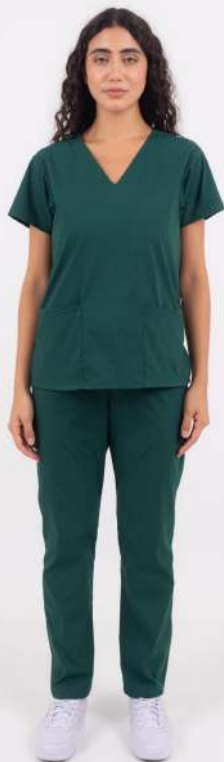
AMBO LISO Full Verde Inglés CORE SPANDEX

FCL1900EXT (FEM) CH LISA Negro CORE SPANDEX UPBD900EXT (UNI) PANT BRAND Negro CORE SPANDEX