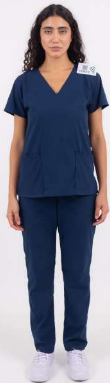
AMBO LISO Full Marino CORE SPANDEX

FCL1580EXT (FEM) CH LISA Verde Inglés CORE SPANDEX UPBD580EXT (UNI) PANT BRAND Verde Inglés CORE SPANDEX