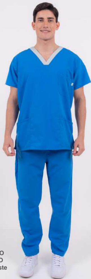
AMBO ECCO Celeste

MCFY418DOT (MAS) CH ECCO Celeste Plus DOTEX Cuello Gris UPFY418DOT (UNI) PANT ECCO Celeste Plus DOTEX