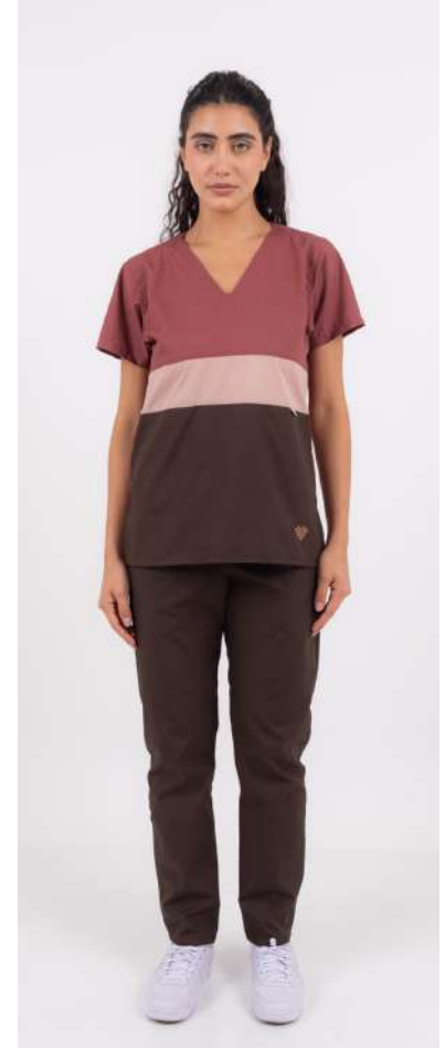
Ambo TRICOLOR Terra FCTR268ART (FEM) CH TRICOLOR Terra ARCIEL UPBD680ART (UNI) PANT BRAND Chocolate ARCIEL