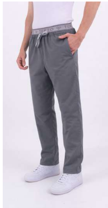
PANT BRAND Grafito

MCFR549ART (MAS) CH DÚO Green UPBD549ART (UNI) PANT BRAND Verde Aqua ARCIEL