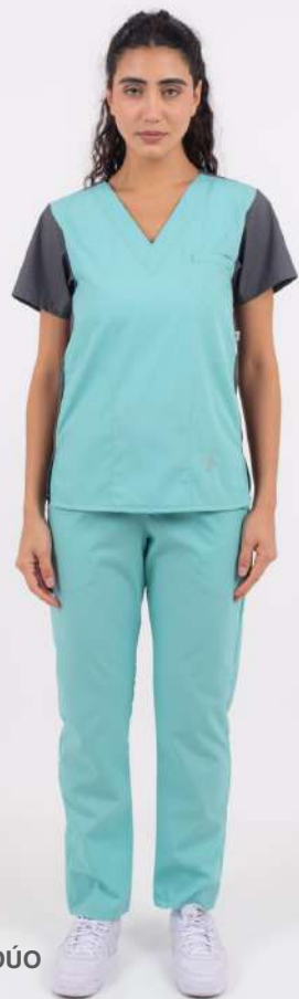
AMBO DÚO Green

FCFR549ART (FEM) CH DÚO Green UPBD549ART (UNI) PANT BRAND Verde Aqua ARCIEL