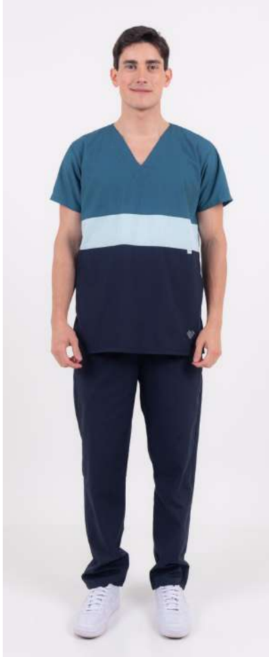
AMBO TRICOLOR Petrel MCTR464ART (MAS) CH TRICOLOR Petrel UPBD680ART (UNI) PANT BRAND Azul Noche ARCIEL