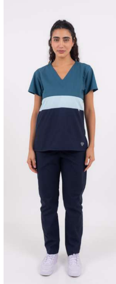
Ambo TRICOLOR Petrel FCTR464ART (FEM) CH TRICOLOR Petrel UPBD680ART (UNI) PANT BRAND Azul Noche ARCIEL