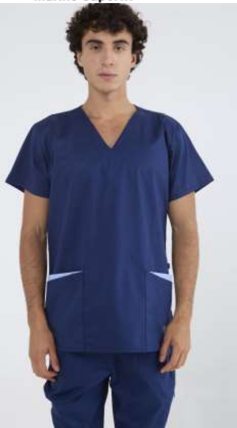
(MAS) AMBO LISO Marino Superfit