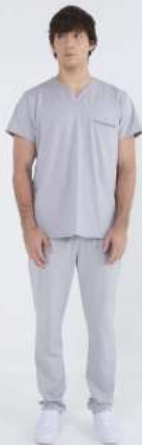
(MAS) AMBO ACTION Gris SPANDEX