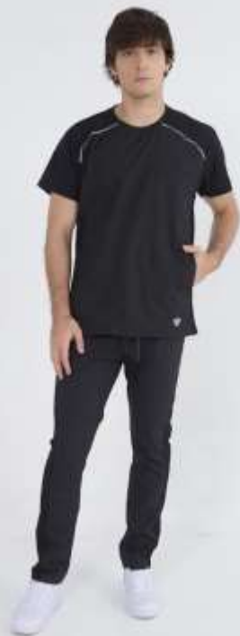
(MAS) AMBO COMFY Negro