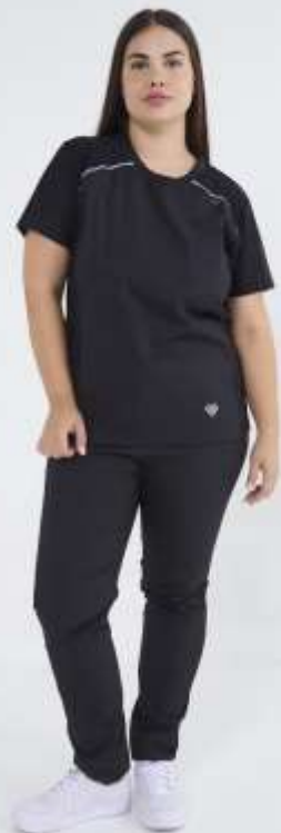
(FEM) AMBO COMFY Francia (FEM) AMBO COMFY Acuario