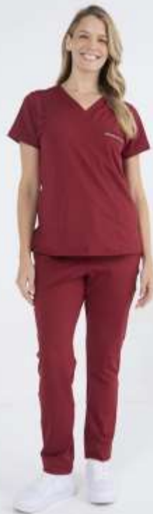
(FEM) AMBO ACTION Bordo SPANDEX