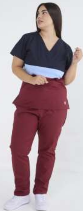
(FEM) Ambo Tricolor Ocaso