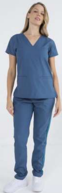
(FEM) AMBO SHAPY Petroleo