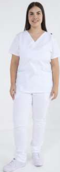
(FEM) AMBO LISO Blanco SUPER- FIT