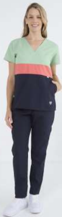
(FEM) Ambo Tricolor Basilea