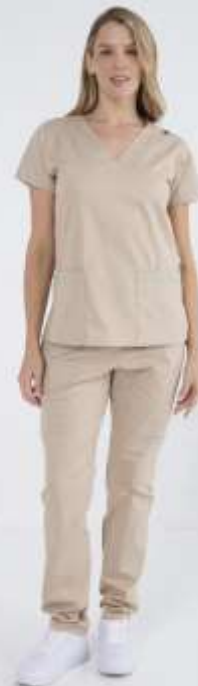
(FEM) AMBO LISO Beige SPANDEX