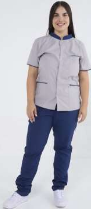
(FEM) Ambo Mao Femenino