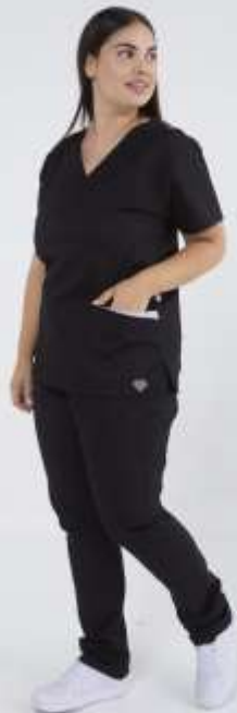
(FEM) AMBO LISO Negro SUPERFIT