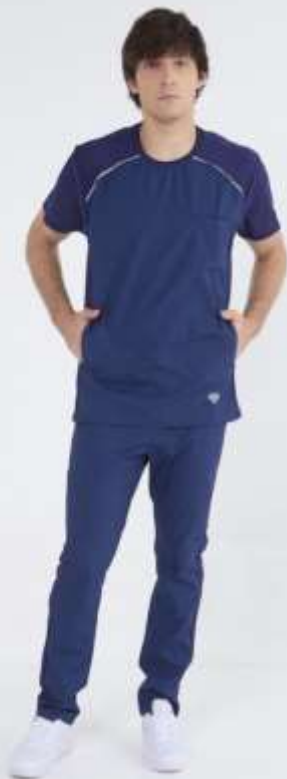
(MAS) AMBO COMFY Marino