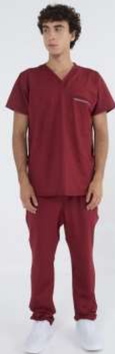
(MAS) AMBO ACTION Bordo SPANDEX