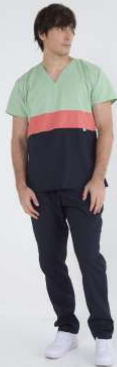
(MAS) Ambo Tricolor Basilea