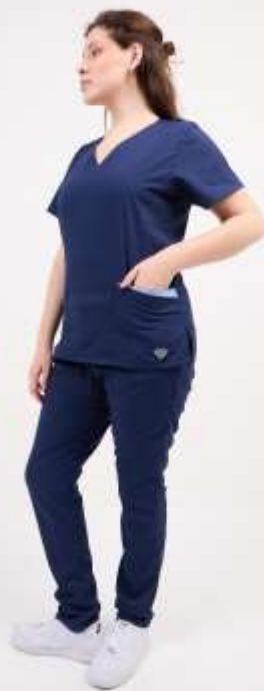
(FEM) AMBO LISO Marino SUPERFIT