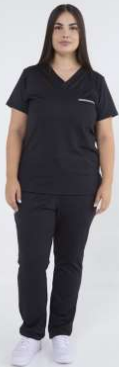
(FEM) AMBO ACTION Negro SPANDEX