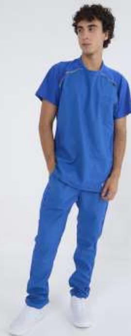
(MAS) AMBO COMFY Francia