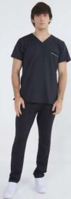
(MAS) AMBO ACTION Negro SPANDEX