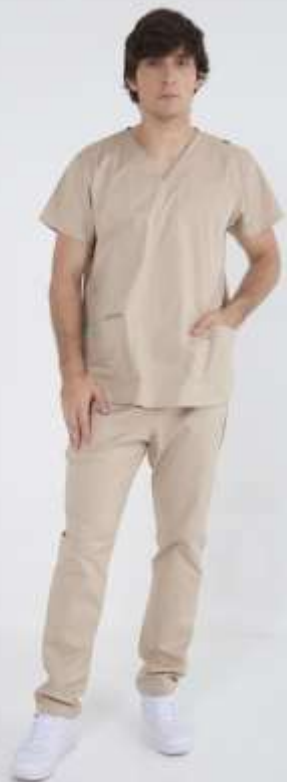
(MAS) AMBO LISO Gris Medio SPANDEX