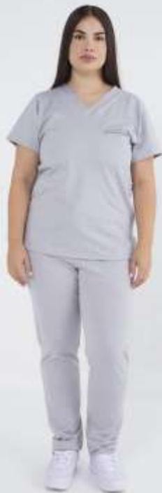
(FEM) AMBO ACTION Gris SPANDEX