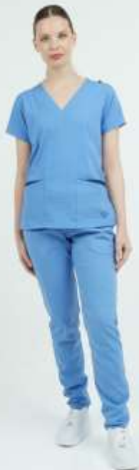
(FEM) AMBO LISO Acuario SUPERFIT