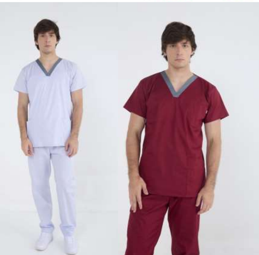
(MAS) Ambo Ecco Marino Spandex