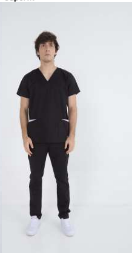
(MAS) AMBO LISO Negro Superfit