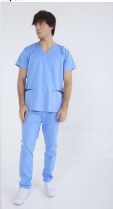
(MAS) AMBO LISO Acuario Superfit