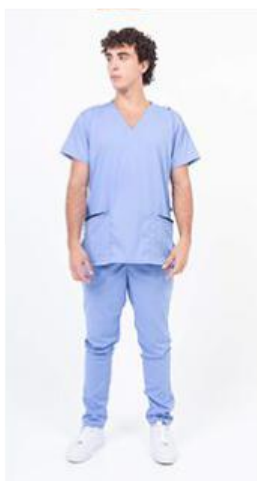
AMBO LISO ACUARIO SUPERFLEX -MCLI418SXT - CH lisa superflex spandex celeste acuario 418 + detalles en azul marino (masc). -UPBD418SXT- PANT superflex spandex celeste acuario (único).