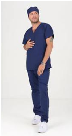
AMBO SHAPY MARINO -MCPY490ART - CH shapy marino arciel/lycra (masculino). -UPPY490ART - PANT shapy marino arciel/lycra (único).