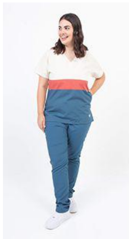
AMBO TRICOLOR NATURAL - FCTR015ART- CH TRICOLOR natural 105 / rojo 268 / petróleo medio 464 arciel. (femenino) -UPBD464ART- PANT brand petróleo medio 464 arciel. (único)