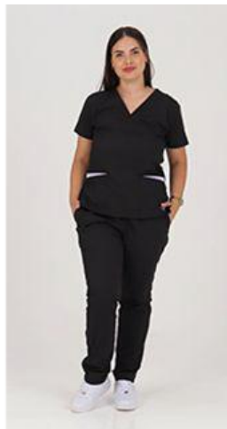
AMBO LISO NEGRO SUPERFLEX -FCLI900SXT - CH lisa superflex spandex negro + detalles en lila (fem). -UPBD900SXT- PANT superflex spandex negro (único).