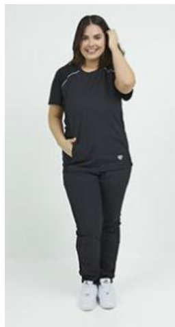
AMBO COMFY NEGRO -FCFY100ART - CH comfy negro 900 arciel / calado fit 900 negro (femenino). -UPFY900ART- PANT comfy negro 900 arciel / calado fit 900 negro (único).