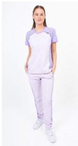
AMBO COMFY LILA -FCFY311ART - CH comfy lila 311 arciel / calado fit 311 lila (femenino). -UPFY311ART- PANT comfy lila 311 arciel / calado fit 311 lila (único).