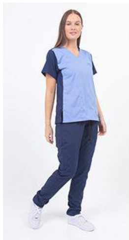
AMBO FRONTE ZAFIRO - FCLI000SXT- CH FRONTE frente celeste acuario, espalda azul marino superflex. (fem) -UPBD490SXT- PANT brand azul noche superflex spandex . (único)