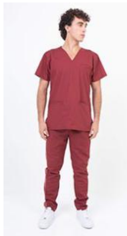
AMBO SHAPY BORDO -MCPY382ART - CH shapy bordo arciel/lycra. (masculino). -UPPY382ART - PANT shapy bordo arciel/lycra (único).