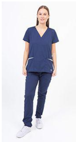
AMBO LISO MARINO SUPERFLEX -FCLI490SXT - CH lisa superflex spandex azul marino 490 + detalles en celeste acuario (fem). -UPBD490SXT- PANT superflex spandex azul noche (único).