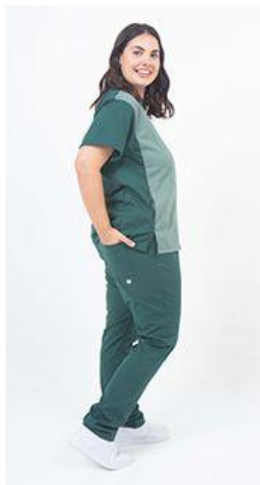
AMBO FRONTE BOSQUE - FCLI001SXT- CH FRONTE frente verde seco, espalda verde inglés superflex. (fem) -UPBD580SXT- PANT brand verde inglés superflex spandex . (único)

CHAQUETA FRONTE en ARCIEL SUPERFLEX SPANDEX, esta tela te permite mayor flexibilidad sumado a la durabilidad de la misma, tiene escote en V con vista interna, Tiene un bolsillo en el pecho y dos laterales con bordado Terzo®. Frente combinado en un color, y espalda a tono con pantalón.