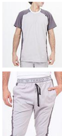
AMBO COMFY GRIS -MCFY711ART - CH comfy gris 711 arciel / calado fit 711 gris (masculino). -UPFY711ART- PANT comfy gris 711 arciel / calado fit 711 gris (único).