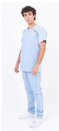
AMBO COMFY CELESTE -MCFY485ART - CH comfy celeste 410 arciel / calado fit 410 celeste (masculino). -UPFY410ART- PANT comfy celeste 410 arciel / calado fit 410 celeste (único).