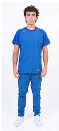
AMBO COMFY FRANCIA -MCFY485ART - CH comfy francia 485 arciel / calado fit 485 francia (masculino). -UPFY485ART- PANT comfy francia 485 arciel / calado fit 485 francia (único).