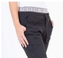
AMBO SHAPY NEGRO -FCPY900ART - CH shapy negro arciel/lycra. (femenino). -UPPY900ART - PANT shapy negro arciel/lycra (único).

CHAQUETA SHAPY en tela ARCIEL que brinda comodidad y resistencia por su calidad y durabilidad, con escote en V y vistas internas, contiene dos bolsillos estilo ojal inferiores y un bolsillo ojal en el pecho, ambos con atraques de seguridad a tono.. Tiene un recorte en la espalda de LYCRA DE SEDA la cual permite mejor absorción, secado rápido de la transpiración y otorga mayor flexibilidad en los movimientos.