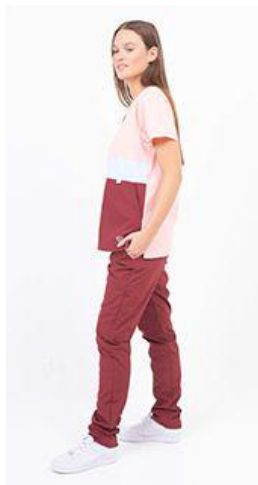
AMBO TRICOLOR BORDO - FCTR016ART- CH TRICOLOR rosa venture 207 / celeste 400 / bordo 382 arciel. (femenino) -UPBD255ART- PANT brand bordo 382 arciel. (único)

CHAQUETA TRICOLOR con tela ARCIEL de alta calidad y ultra durable, cuello en V, Se trata de una combinación de tres colores de tendencia en frente superior e inferior y la espalda en un solo color liso. Tiene dos bolsillos diagonales tipo canguro amplios disimulados. También cuenta con abertura en los laterales tipo tajo para mejorar la amplitud de cadera. Por último el logo Terzo® bordado sobre la franja inferior a contratono como detalle exclusivo.