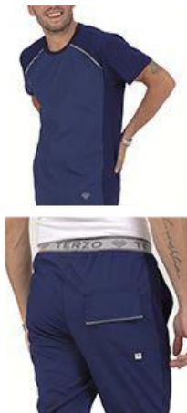
AMBO COMFY MARINO -MCFY490ART - CH comfy marino 490 arciel / calado fit 490 marino (masculino). -UPFY490ART- PANT comfy marino 490 arciel / calado fit 490 marino (único).