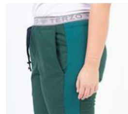
AMBO SHAPY VERDE INGLÉS -FCPY580ART - CH shapy verde inglés arciel/lycra. (femenino). -UPPY580ART - PANT shapy verde inglés arciel/lycra (único).