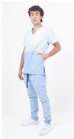
AMBO TRICOLOR HIELO - FCTR016ART- CH TRICOLOR hielo 400 / 708 / 410 celeste clásico arciel. (masculino) -UPBD410ART- PANT brand celeste clásico 410 arciel. (único)

CHAQUETA TRICOLOR con tela ARCIEL de alta calidad y ultra durable, cuello en V, Se trata de una combinación de tres colores de tendencia en frente superior e inferior y la espalda en un solo color liso. Tiene dos bolsillos diagonales tipo canguro amplios disimulados. También cuenta con abertura en los laterales tipo tajo para mejorar la amplitud de cadera. Por último el logo Terzo® bordado sobre la franja inferior a contratono como detalle exclusivo.