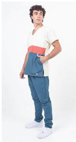
AMBO TRICOLOR NATURAL - MCTR015ART- CH TRICOLOR natural 105 / rojo 268 / petróleo medio 464 arciel. (masculino) -UPBD730ART- PANT brand petróleo medio 464 arciel. (único)