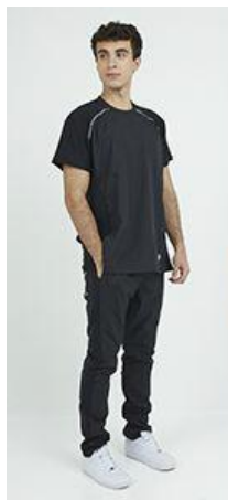
AMBO COMFY NEGRO -MCFY900ART - CH comfy negro 900 arciel / calado fit 900 negro (masculino). -UPFY900ART- PANT comfy negro 900 arciel / calado fit 900 negro (único).