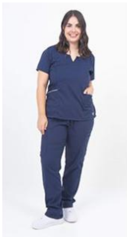
AMBO PLUS MARINO SPANDEX SUPERFLEX -FCPL490SXT - CH PLUS marino superflex spandex vivo reflectivo. (femenino). -UPPL490SXT- PANT plus marino superflex spandex (único).