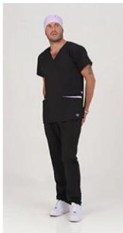
AMBO LISO NEGRO SUPERFLEX -MCLI900SXT - CH lisa superflex spandex negro + detalles en lila (masc). -UPBD900SXT- PANT superflex spandex negro (único).