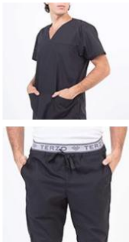
AMBO SHAPY NEGRO -MCPY900ART - CH shapy negro arciel/lycra (masculino). -UPPY900ART - PANT shapy negro arciel/lycra (único).

CHAQUETA SHAPY en tela ARCIEL que brinda comodidad y resistencia por su calidad y durabilidad, con escote en V y vistas internas, contiene dos bolsillos estilo ojal inferiores y un bolsillo ojal en el pecho, ambos con atraques de seguridad a tono.. Tiene un recorte en la espalda de LYCRA DE SEDA la cual permite mejor absorción, secado rápido de la transpiración y otorga mayor flexibilidad en los movimientos.