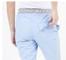
AMBO COMFY CELESTE -FCFY410ART - CH comfy celeste 410 arciel / calado fit 410 celeste (femenino). -UPFY100ART- PANT comfy celeste 410 arciel / calado fit 410 celeste (único).

CHAQUETA COMFY Arciel cuello redondo de Rib de algodón o poliéster, con cordón porta credencial en hombro y dos bolsillos inferiores amplios. Sus recortes spandex con tecnología de tela calada deportiva que permite mejor absorción, secado rápido de la transpiración, respiración de la piel y otorga mayor flexibilidad en los movimientos. Con detalle reflectivo en frente.