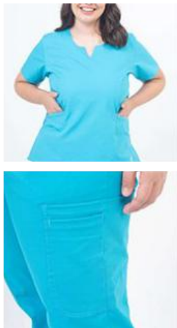
AMBO PLUS TURQUESA SUPERFLEX -FCPL450XT - CH PLUS turquesa superflex spandex vivo reflectivo. (femenino). -UPPL450SXT- PANT plus turquesa superflex spandex (único).