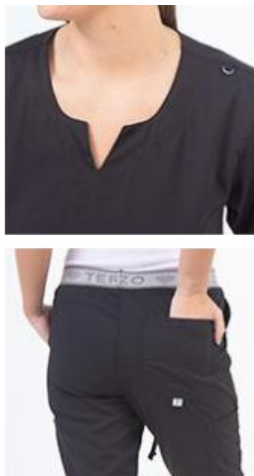
AMBO PLUS NEGRO SPANDEX -FCPL900SXT - CH PLUS negro superflex spandex vivo reflectivo. (femenino). -UPPL900SXT- PANT plus negro superflex spandex (único).

CHAQUETA LISA en ARCIEL SUPERFLEX SPANDEX. Nuevo producto con escote curvo y vista interna, con dos bolsillos diagonales amplios con vivo reflectivo, en colores llamativos y clásicos SUPERFLEX. Cuenta con pinzas en el frente y espalda para dar una calce más al cuerpo y entallado. Tiene logo Terzo bordado sobre el bolsillo izquierdo.