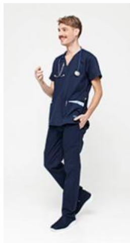
AMBO LISO MARINO SUPERFLEX -MCLI490SXT - CH lisa superflex spandex azul marino 490 + detalles en celeste acuario (masc). -UPBD490SXT- PANT superflex spandex azul noche (único).