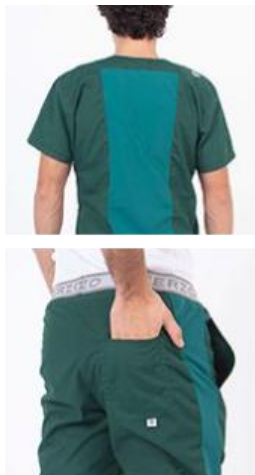
AMBO SHAPY VERDE INGLÉS -MCPY580ART - CH shapy verde inglés arciel/lycra (masculino). -UPPY580ART - PANT shapy verde inglés arciel/lycra (único).