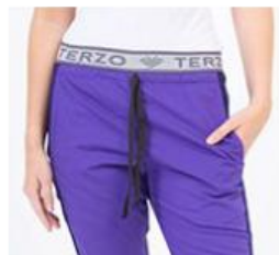
AMBO COMFY ULTRA -FCFY378ART - CH comfy ultra 378 arciel / calado fit 378 ultra (femenino). -UPFY378ART- PANT comfy ultra 378 arciel / calado fit 378 ultra (único).

CHAQUETA COMFY Arciel cuello redondo de Rib de algodón o poliéster, con cordón porta credencial en hombro y dos bolsillos inferiores amplios. Sus recortes spandex con tecnología de tela calada deportiva que permite mejor absorción, secado rápido de la transpiración, respiración de la piel y otorga mayor flexibilidad en los movimientos. Con detalle reflectivo en frente.