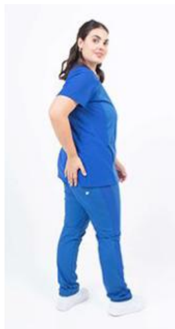
AMBO COMFY FRANCIA -FCFY485ART - CH comfy francia 485 arciel / calado fit 485 francia (femenino). -UPFY485ART- PANT comfy francia 485 arciel / calado fit 485 francia (único).