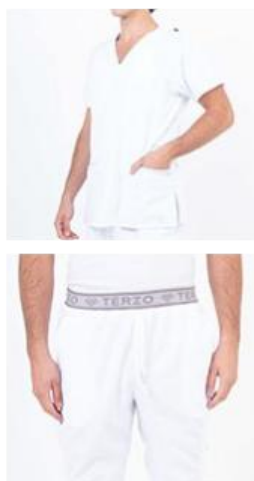
AMBO LISO BLANCO SPANDEX -MCLI100SXT - CH lisa superflex spandex blanco + detalles en celeste bebe (masc). -UPBD100SX- PANT superflex spandex blanco (único).

CHAQUETA LISA en ARCIEL SUPERFLEX SPANDEX, esta tela te permite mayor flexibilidad sumado a la durabilidad de la misma, tiene escote en V con vista interna, además de un cordón porta credencial en el hombro para que no la pierdas, le sumamos dos bolsillos diagonales amplios con fondo de bolsillos a contratonos, con un lapicero divisorio, en combinaciones que no dejan de ser un clásico. Por último el logo Terzo bordado sobre la franja inferior a contratonos como detalle exclusivo.