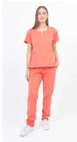
AMBO PLUS CADMIO SPANDEX -FCPL255SXT - CH PLUS cadmio superflex spandex vivo reflectivo. (femenino). -UPPL255SXT- PANT plus cadmio superflex spandex (único).