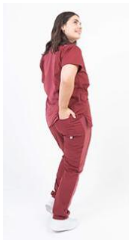
AMBO SHAPY BORDO -FCPY382ART - CH shapy bordo arciel/lycra. (femenino). -UPPY382ART - PANT shapy bordo arciel/lycra (único).