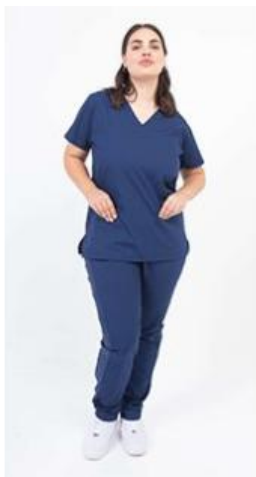
AMBO SHAPY MARINO -FCPY490ART - CH shapy marino arciel/lycra. (femenino). -UPPY490ART - PANT shapy marino arciel/lycra (único).