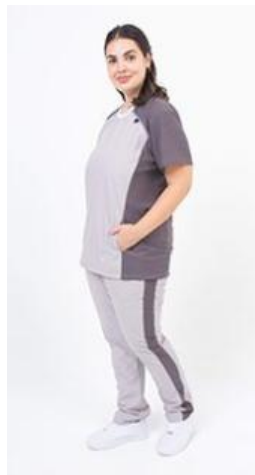
AMBO COMFY NEGRO -FCFY711ART - CH comfy gris 711 arciel / calado fit 711 gris (femenino). -UPFY711ART- PANT comfy gris 711 arciel / calado fit 711 gris (único).