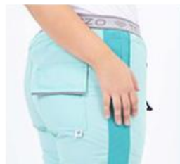
AMBO COMFY VERDE -FCFY549ART - CH comfy verde 549 arciel / calado fit 549 verde (femenino). -UPFY549ART- PANT comfy verde 549 arciel / calado fit 549 verde (único).