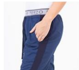
AMBO COMFY MARINO -FCFY490ART - CH comfy marino 490 arciel / calado fit 490 marino (femenino). -UPFY490ART- PANT comfy marino 490 arciel / calado fit 490 marino (único).