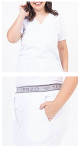
AMBO LISO BLANCO SPANDEX -FCLI100SXT - CH lisa superflex spandex blanco + detalles en celeste bebe (fem). -UPBD100SXT- PANT superflex spandex blanco (único).

CHAQUETA LISA en ARCIEL SUPERFLEX SPANDEX, esta tela te permite mayor flexibilidad sumado a la durabilidad de la misma, tiene escote en V con vista interna, además de un cordón porta credencial en el hombro para que no la pierdas, le sumamos dos bolsillos diagonales amplios con fondo de bolsillos a contratonos, con un lapicero divisorio, en combinaciones que no dejan de ser un clásico. Por último el logo Terzo bordado sobre la franja inferior a contratonos como detalle exclusivo.