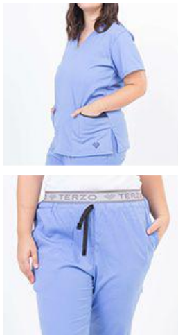
AMBO LISO ACUARIO SUPERFLEX -FCLI418SXT - CH lisa superflex spandex celeste acuario 418 + detalles en azul marino (fem). -UPBD418SXT- PANT superflex spandex celeste acuario (único).