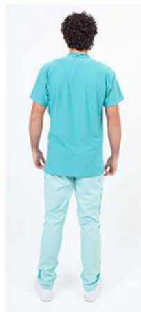
AMBO COMFY VERDE -MCFY549ART - CH comfy verde 549 arciel / calado fit 549 verde (masculino). -UPFY549ART- PANT comfy verde 549 arciel / calado fit 549 verde (único).

CHAQUETA COMFY Arciel cuello redondo de Rib de algodón o poliéster, con cordón porta credencial en hombro y dos bolsillos inferiores amplios. Sus recortes spandex con tecnología de tela calada deportiva que permite mejor absorción, secado rápido de la transpiración, respiración de la piel y otorga mayor flexibilidad en los movimientos. Con detalle reflectivo en frente.